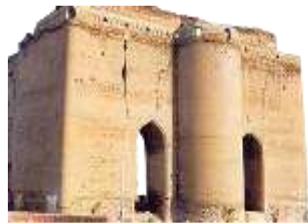
Ark Daily Newspaper